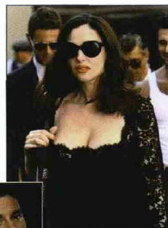
Monica Bellucci durante lo spot di Martini Gold e a sinistra Dolce & Gabbana

nero". La collaborazione Martini-Dolce & Gabbana ha origine nel 1998 con l'apertura di un primo Martini-bar all'interno della boutique milanese dei due stilisti. Oggi prosegue con Martini Gold per i cui spot pubblicitari è stata scelta come testimonial protagonista Monica Bellucci. www.martini.com www.dolcegabbana.com www.martini.com